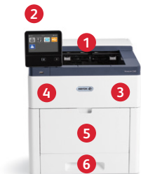
Stampante a colori Xerox® VersaLink® C500 Stampa.