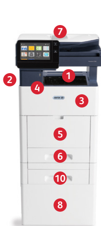
Stampante multifunzione a colori Xerox® VersaLink® C505 Stampa. Copia. Scansione. Fax. E-mail.