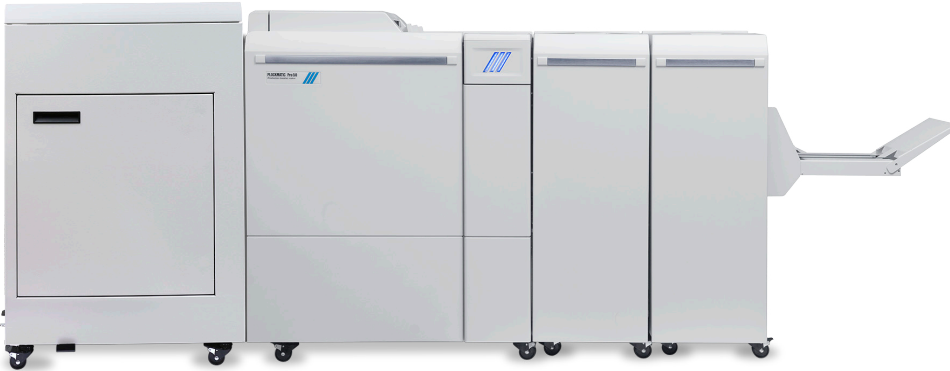
Plockmatic Pro50/35 Booklet Maker, prodotta da Plockmatic International AB

Create libretti di qualità professionale alla massima velocità nominale grazie a una soluzione in linea compatta ed economica.